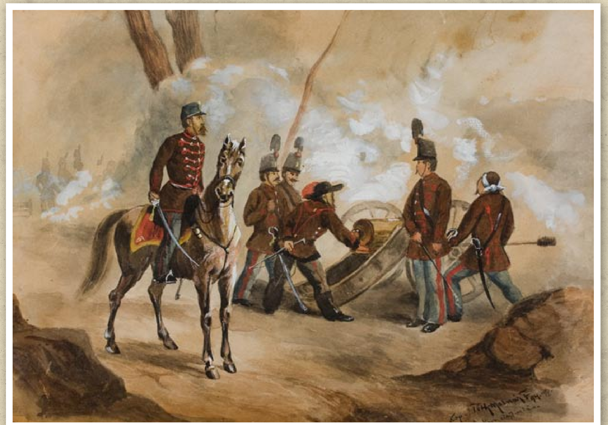
Bem tábornok katonái között (Tóth Molnár Ferenc festménye)