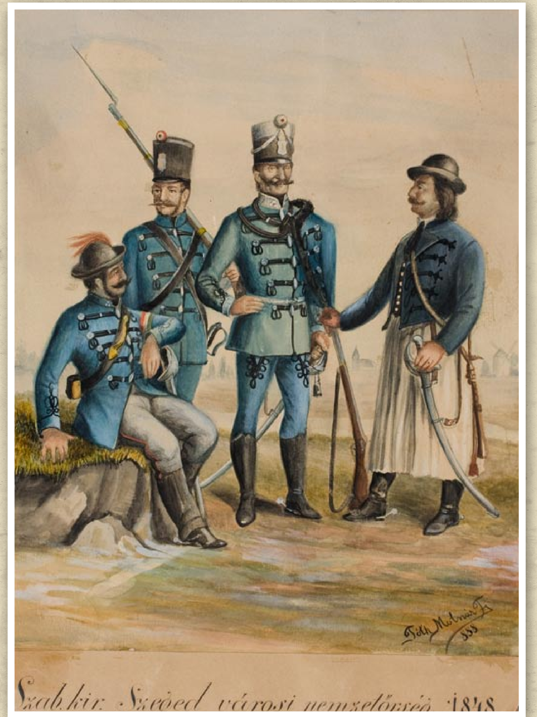
Szab. kir. Szeged városi nemzetőrök 1848

Miután a Habsburg uralkodó alapjaiban ellenezte a magyar igényeket a forradalom fokozatosan véres szabadságharccá alakult, amelyben a magyarság a nemzeti függetlenséget és az Ausztriától való elszakadást akarta kivívni. Ebből a harcból kivette részét Szeged és a mai Csongrád megye területének jelentős része. Ebben a régióban szervezték meg a későbbi aradi vértanú, Damjanich János vezette III. honvéd zászlóaljat. A térségben a Habsburg dinasztiát támogató szerb fölkelők több települést (például Szőreget, Deszket, Újszentivánt) földúltak. Szeged a szabadságharc végső szakaszában – 1849 júliusának utolsó napjaiban – az országgyűlés és a kormány székhelye volt, s a szőregi csatát (1849. augusztus 5.) a szabadságharc egyik zárófejezeteként tartja számon a magyar hadtörténet.