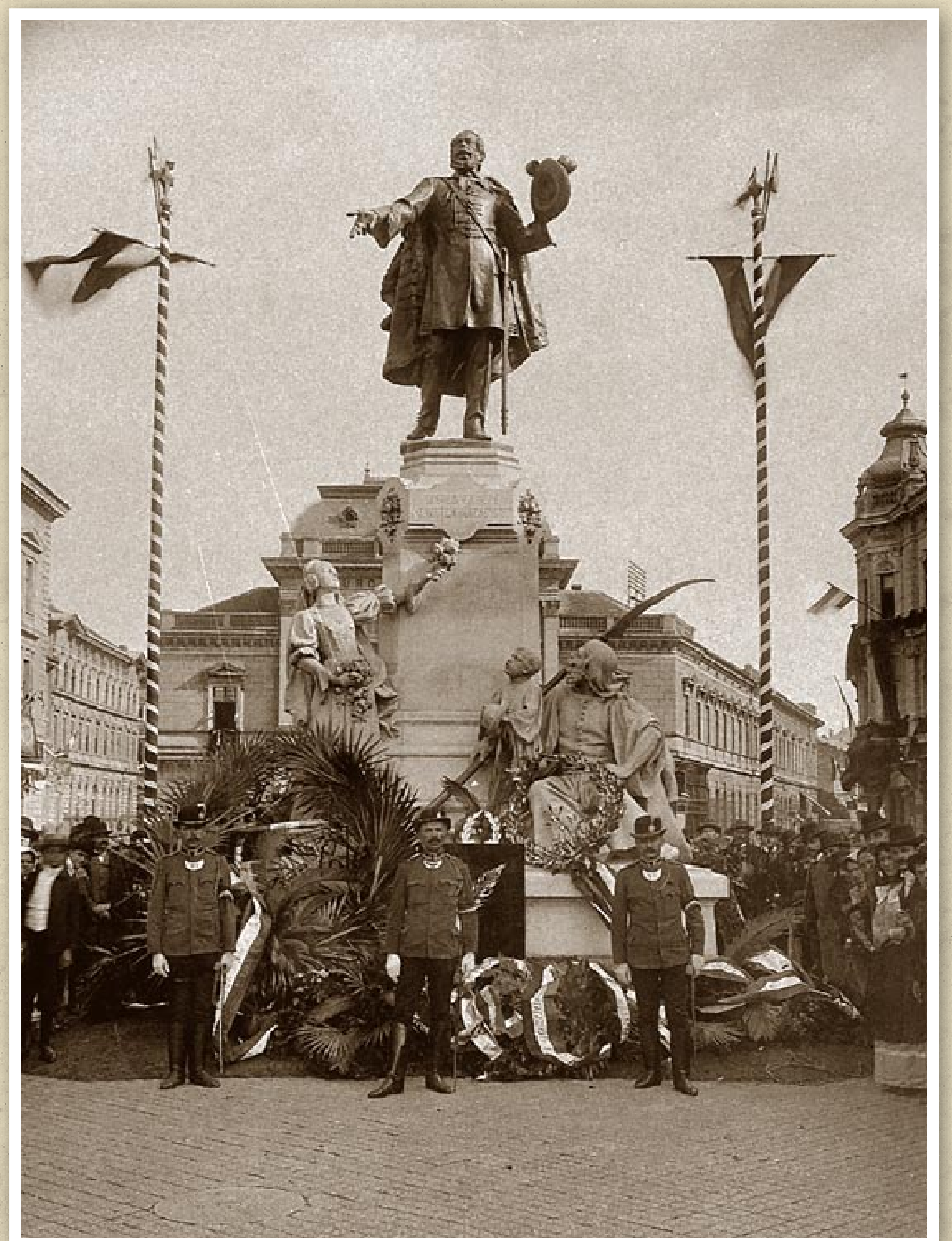
Kossuth Lajos szegedi szobrának avatása (1902)