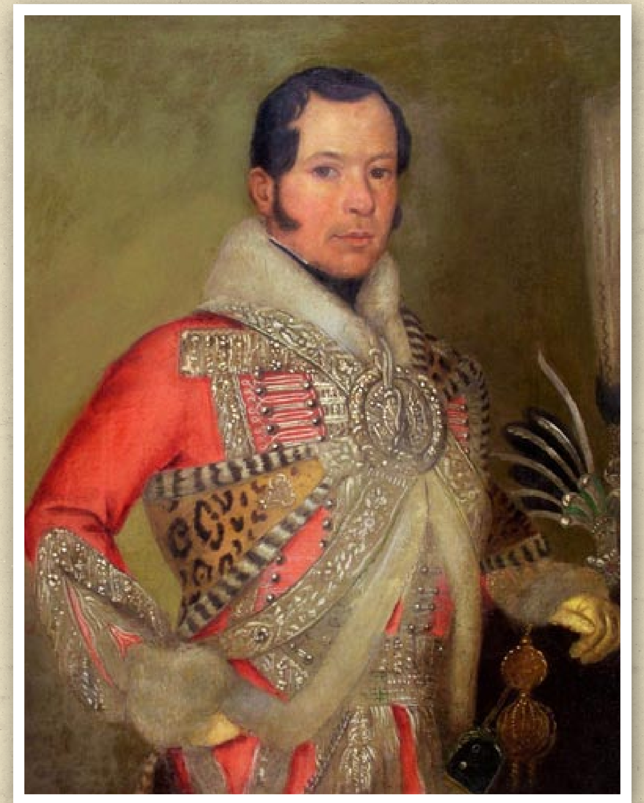
Répásy Mihály (1800–1849) honvéd tábornok Szegeden hunyt el a városban pusztító kolerajárvány áldozataként