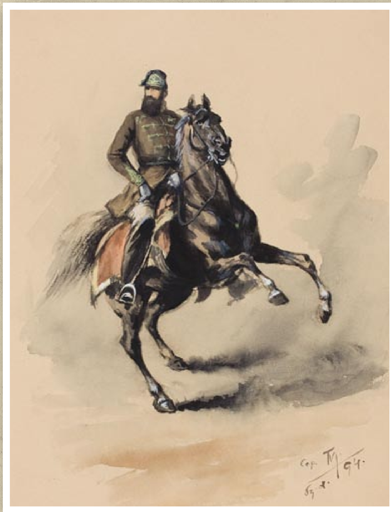
Damjanich János tábornok (Tóth Molnár Ferenc festménye)

A III. zászlóalj 1018 (a Nagyváradról késve érkezőkkel együtt 1146) főből állt, akik közül 150 fő volt szegedi. A honvédek között nagyszámú értelmiségit találunk (mérnök, orvos, ügyvéd és egyéb honorácior-foglalkozások, valamint a főgimnázium idősebb növendékei), de a többség az országos arányoknak megfelelően céhlegény, iparossegéd, szegényparaszt, napszámos, zsellér volt. 1848 nyarától a zászlóalj parancsnoka Damjanich János volt. A honvédek a szabadságharc alatt számos ütközetben vettek részt, különösen kitűntették magukat a győztes szolnoki csatában (1849. március 5.). 1878-ban, a zászlóalj megalakulásának harmincadik évfordulóján az egykori tagok egy része arcképükkel ellátott tablót készíttetett.