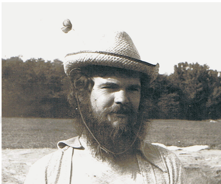
Ásátáson Sándorfalván (1979)