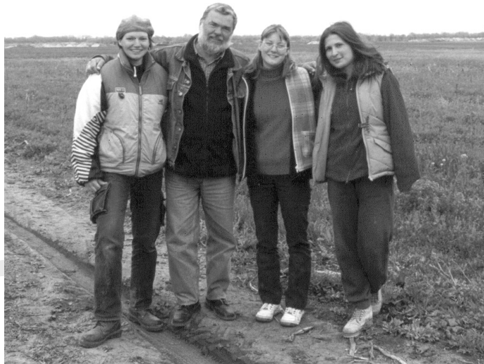
Egyetemi hallgatókkal az algyői ásatáson (2004)

kiállítások rendezése volt az, amivel legszívesebben foglalkoztam. Több kisebb rendezés közül az 1990. évi finnugor kongresszus alkalmából készített „Honfoglalóink ezüstjei”-t tartom említésre méltónak, a Lőrinczy Gáborral közösen, nem kis munkával fel-