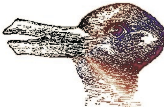
A balkezesek nyulat, a jobbosok kacsát látnak

McCartney, Jimi Hendrix, Bob Geldof és Kurt Cobain. A hang-