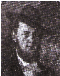
Greguss Imre – Önarckép (1856–1910)

A 2017 tavaszán átrendezett múzeumi díszterem képei között a „Zách Klára” (1908) című olajfestmény egyike a régi sérüléseiből helyreállított műveknek. Festője, az egykori Trencsén vármegyei Zayugrócon született Greguss Imre (1856–1910) a budapesti, Tavaszmező utcai Magyar Királyi Állami Főgimnázium rajztanára volt. Noha az alkotás a művész hagyatékából már 1910-ben Szegedre érkezett, a nagyközönség előtt csak most mutatják be először. A művészcsaládból származó festőt méltatlanul elfeledték a művészetkedvelő új generációk: így Greguss Imre munkáinak előtérbe helyezése napjaink egyik megtisztelő kötelessége.