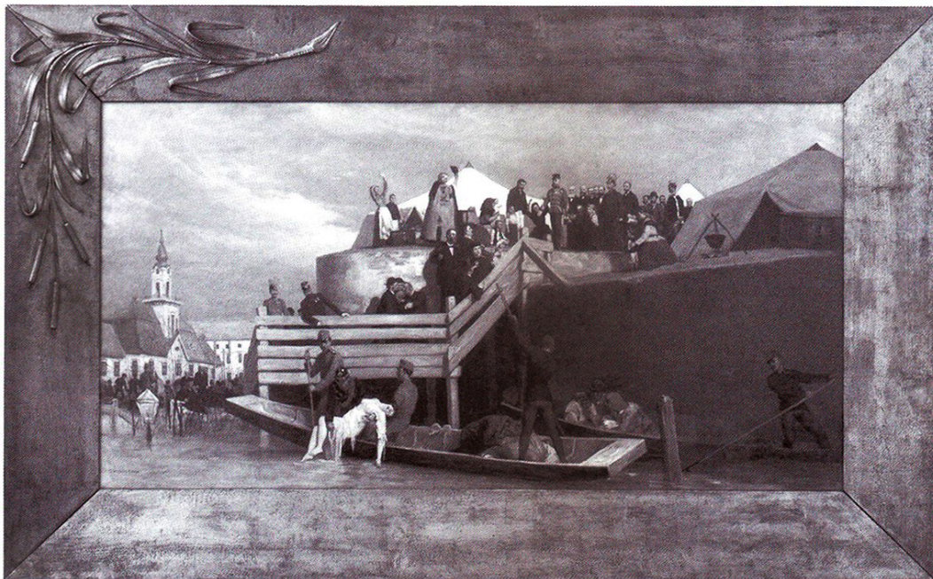
„Szeged szebb lesz mint volt”, 1888 (Ferenc József a vár Széchenyi tér felőli rondelláján. (A kép a királyi műgyűjtemény része volt. Móra Ferenc Múzeum)