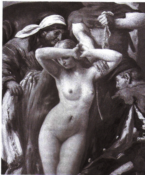
Képrészlet a legendás jelenetből

A képen voltaképpen a középkori magyar történelem leghírhedtebb merényletnek, Zách Felicián semprei várnagyhoz kapcsolódó történet egyik bosszú-jelenetét látjuk. Az egykori híresztelések a visegrádi palotában a főúr leányának, Zách Klárának, Károly Róbert király felesége egyik udvarhölgyének megrontásáról szóltak. Eszerint Piast Erzsébet magyar királyné cselszövésével szolgáltatta ki a főúr szűz leányát az udvarban időző fivére, Kázmér lengyel herceg kénye- kedvének. Miután a leány bevallotta szégyenét apjának, Felicián 1330. április 17-én elégtételt keresve karddal rontott az éppen ebédelő királyi családra.