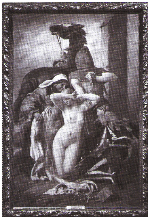
A Zách Klára-festmény (1908) a művész hagyatékából, Móra Ferenc Múzeum

Noha Greguss fölfogásában „Zách Klára” alakja érzelmi látványként vetül a szemlélő elé, a jelenet kissé groteszk összehatású. A „tetszeni vágyó” ábrázolás közkedveltsége a művész esetében nem véletlen: az alkotás – a nagyközönség elvárásának eleget téve – szándékosan erotikus, de festője a részvét érzetének kinyilvánításán kívül állást foglal a megrontott leány erkölcsi tisztasága mellett is. Kiolvasható a munkából az a gregussi törekvés, hogy nem csupán az elképzelt végzetes történelmi pillanatot láttatja, amikor a hóhér királyi parancsra lófarkhoz kötözi a mezítelen áldozatot, hanem a művészcset a női test alabástrom színeivel eszményített szépséggé, ártatlanná és egyben büntelenné magasztosítja Zách Klárát.