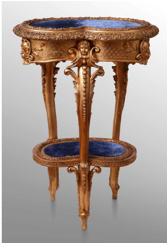
Restaurált állapot, 2015