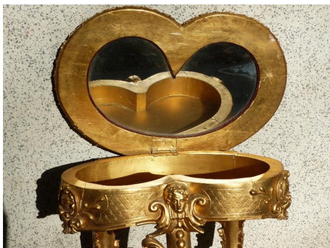
A felnyitott tükrös asztalka Átvételi állapot, 2014