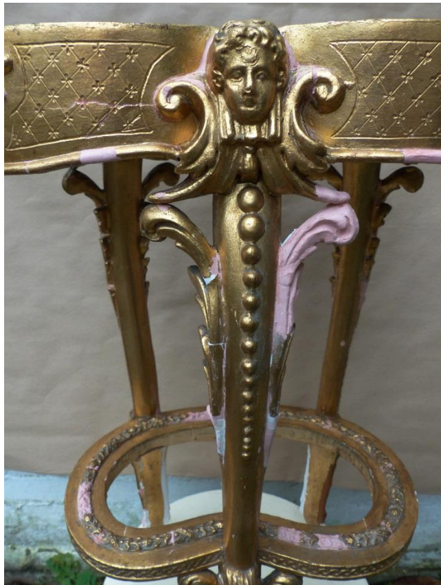
A díszek formai pótlása, formázása közben..., 2014

A csengődi buckákon 1901-ben Joó Ilonka első férjével, az akkor már országhatáron túl ismertté vált nótaszerző Dankó Pistával (1858–1903) szőlőt és hozzá kis „tornyos” házat vásárolt. A „vonó mágusa” élete utolsó két évét legsúlyosabb betegen itt élte. — A forrásadatok alapján Csengődön az asztalka eredeti funkciójától eltérő egyedi szerepet is betöltött: erre helyezte el Ilonka Dankó Pista egyik utolsó hegedűjét, hogy az egyre gyakrabban gyengélkedő, az élettől búcsúzó dalköltő a betegágyából könnyebben elérhesse. A nótaköltőt a halál 1903. március 29-én sógorának pesti lakásában érte. Holttestét özvegye Budapestről Szegedre hozatta; a múzeum előtt ravatalozták föl, Pósa Lajos dalszerző és Tömörkény István író búcsúztatta. A szegedi Belvárosi temetőbe temették. A legkedvesebbet és a legutolsó hegedűjét, amely a végső órájáig keze ügyében lehetett, családja összetörve – mint egykor a vezérek sírjában az összetört kardot – és a koporsójában elhelyezte. 1910-ben elkészült a dízsír hely, lemenő napot ábrázoló domborművel.